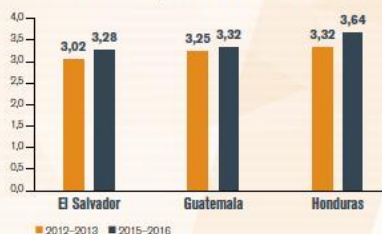
Índice Global de Competitividad-Ambiente Institucional

Fuente: Índice Global de Competitividad, WEF, 2016.